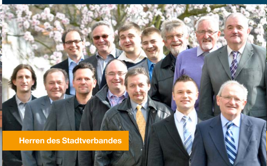
Herren des Stadtverbandes