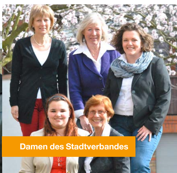
Damen des Stadtverbandes