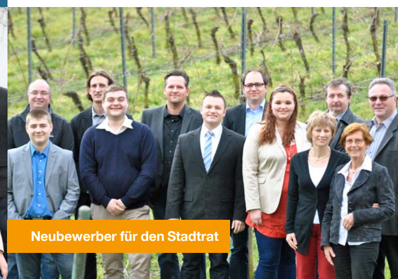
Neubewerber für den Stadtrat