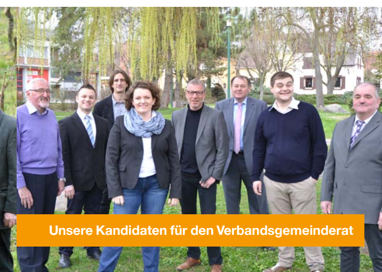
Unsere Kandidaten für den Verbandsgemeinderat